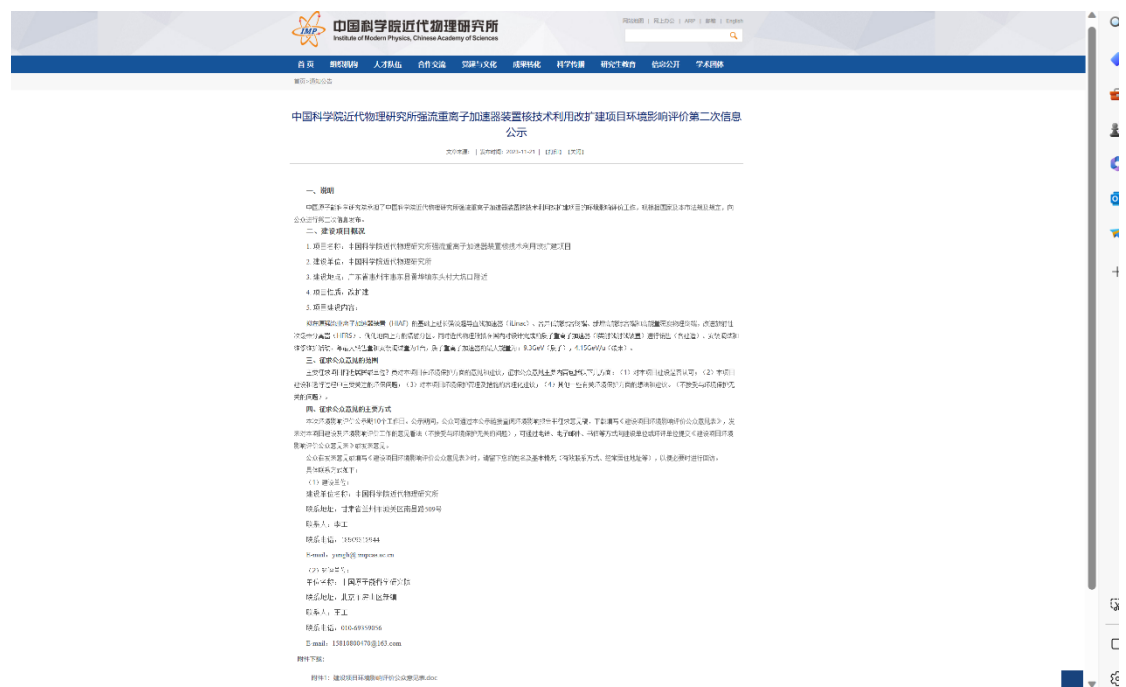
图 3-1 网络公示的网站截图

选择建设单位网站进行公开符合《环境影响评价公众参与办法》的要求，可以满足公示需要，公示起止日期为 2023 年 11 月 21 日-2023 年 12 月 4 日，网络公示链接为： https://www.imp.cas.cn/tzgg2017/202311/t20231121_6936451.html 下图为网络公示的网站截图。