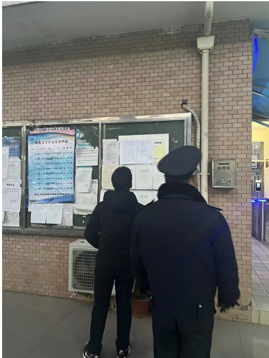
图 3-5 兰州市园区公告张贴现场照片（远景）