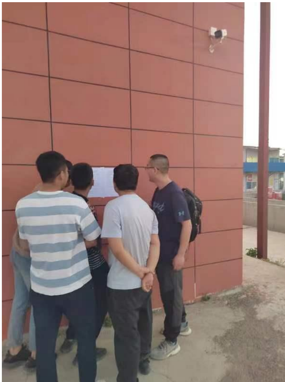
图 3-3 惠州装置区公告张贴现场照片（远景）

公告张贴选取在惠州装置区中科院强流重离子加速器装置项目部门口以及兰州市园区公告栏处，此两处人流量较大，公众易于知悉，符合《环境影响评价公众参与办法》要求，可满足公示需求，公告张贴时间为 2023 年 11 月 21 日-2023 年 12 月 4 日，公告张贴的现场照片见下图。